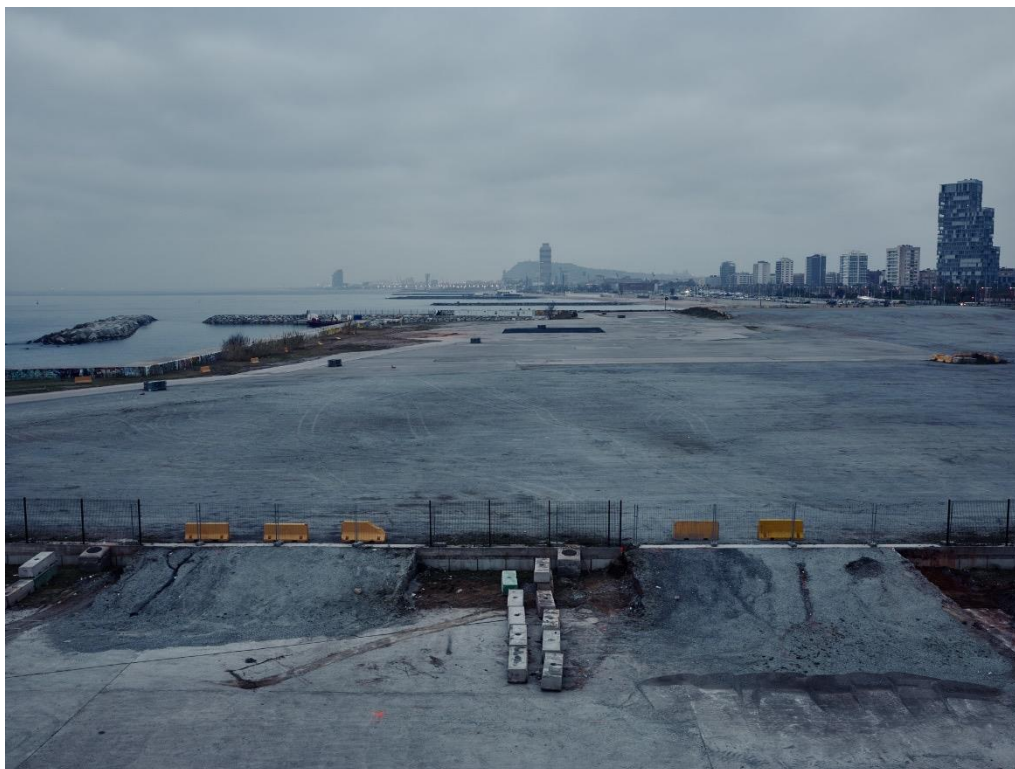
Campo de la Bota I. Barcelona. (2017).