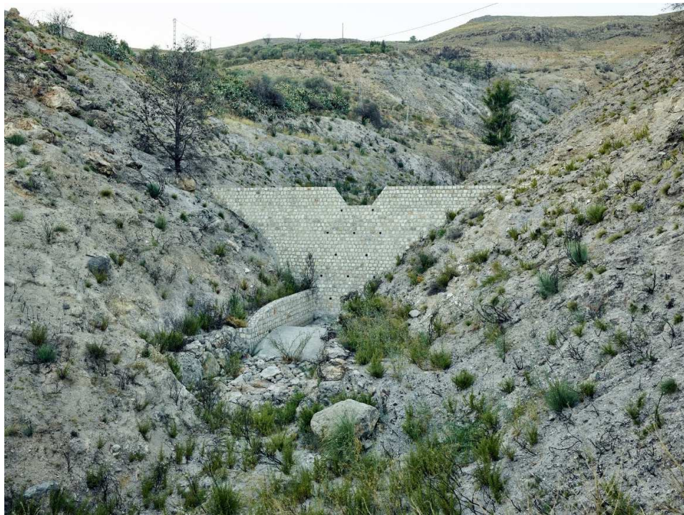
Barranco del Carrizal. Órgiva, Granada